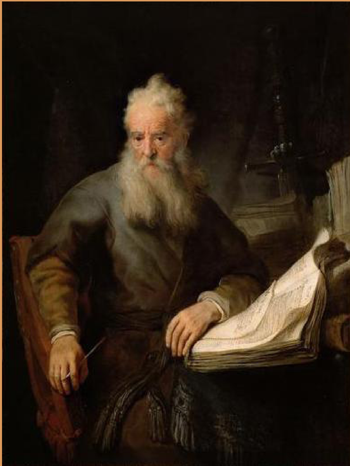
L'apôtre Paul, Rembrandt, vers 1633, huile sur toile. Vienne, Kunsthistorisches Museum